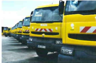
Financement d'une flotte de camions