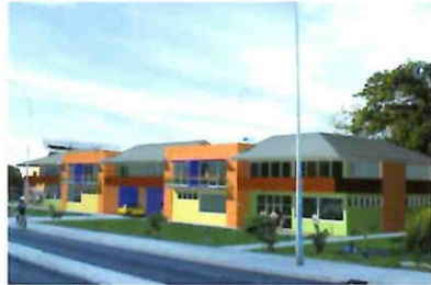
Financement d'une boulangerie (bâtiment et outil productif)