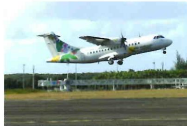
Financement d'une flotte d'avions de transports régionaux