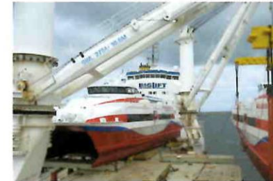
Financement d'une flotte de navires de transport inter-îles