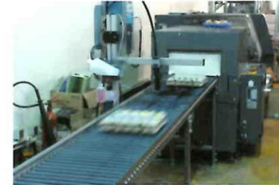
Financement d'une chaîne de production