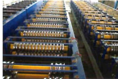
Financement d'une chaîne d'embouteillage